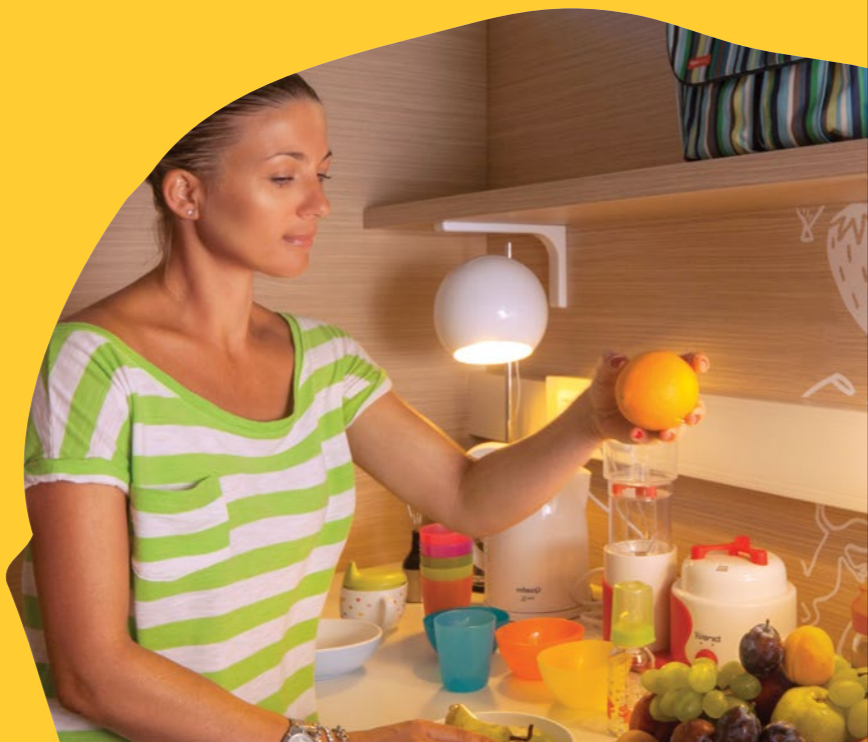
Kutak za mame Svježi obrok za dijete 24/7