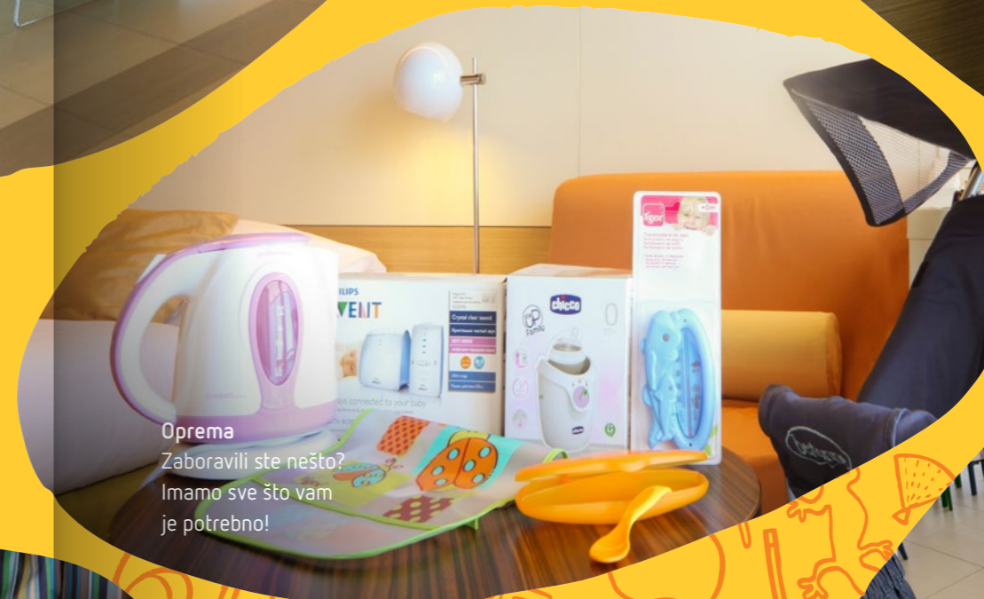
Oprema Zaboravili ste nešto? Imamo sve što vam je potrebno!

Cijeli hotel napravljen je po mjeri djeteta tako da, od recepcije pa sve do sobe, djeca mogu sudjelovati u svim aktivnostima - prijaviti se na recepciji ili večerati u restoranu u prostoru prilagođenom isključivo djeci. Veselih i šarenih boja, uz Pina i Pinetu, Family Hotel Vespera vaš je najbolji izbor za obiteljski odmor iz snova!