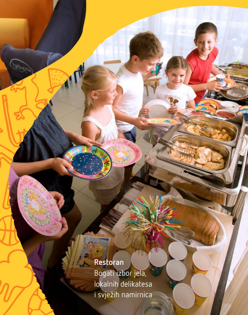
Restoran Bogati izbor jela, lokalnih delikatesa i svježih namirnica