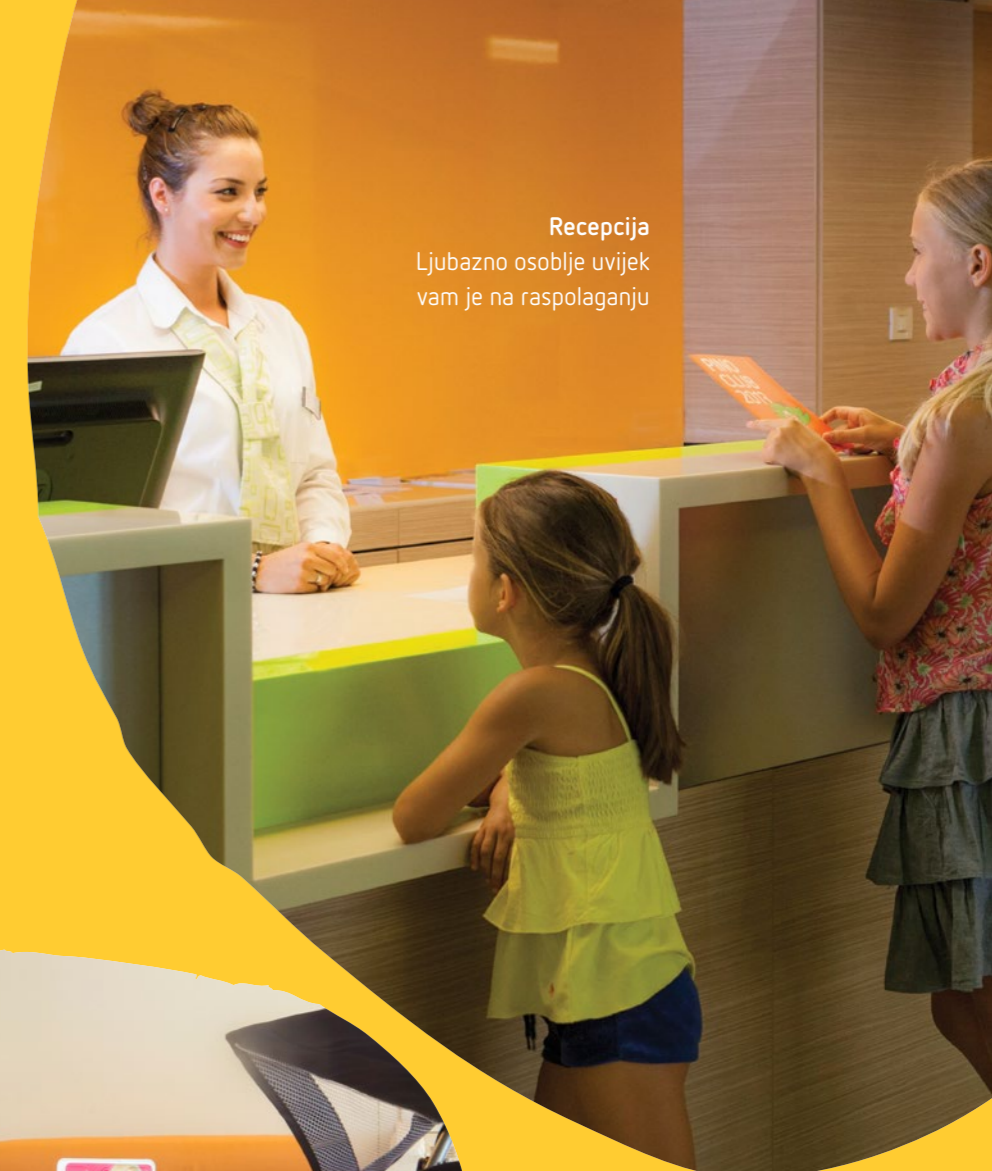
Recepcija Ljubazno osoblje uvijek vam je na raspolaganju

Family Hotel Vespera jedini je hotel u Hrvatskoj koji nosi prestižnu licenciju KINDERHOTELS Europe. Prilagođen je djeci svih uzrasta, ali i roditeljima, s ciljem da odmor na Lošinj bude najljepša uspomena. Posebno osmišljeni sadržaji i usluge koje nudimo omogućit će da se osjećate ugodno, kao kod kuće.