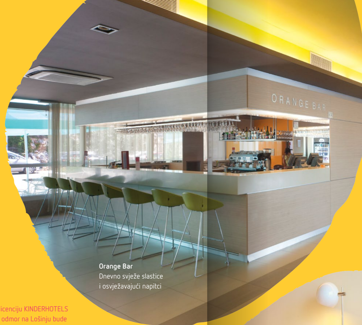
Orange Bar Dnevno svježe slastice i osvježavajući napitci